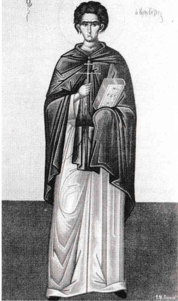
Sfântul Ioan Colibașul

Așadar, susținuți nu doar de oameni, dar și de Dumnezeu și de sfinți, am stăruit în rugăciune, sperând că într-o zi marea minune se va întâmpla și în viața noastră.