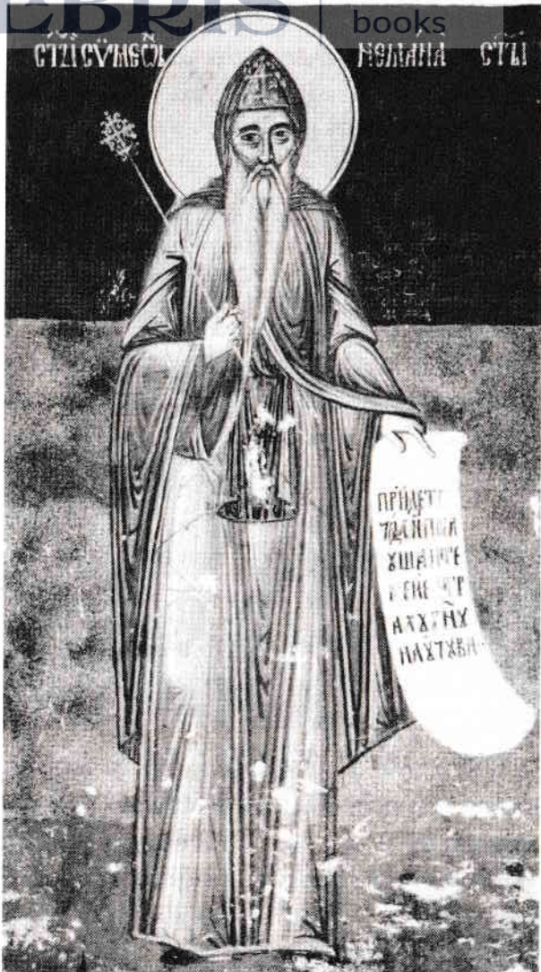
Sfântul Simeon izvorătorul de mir