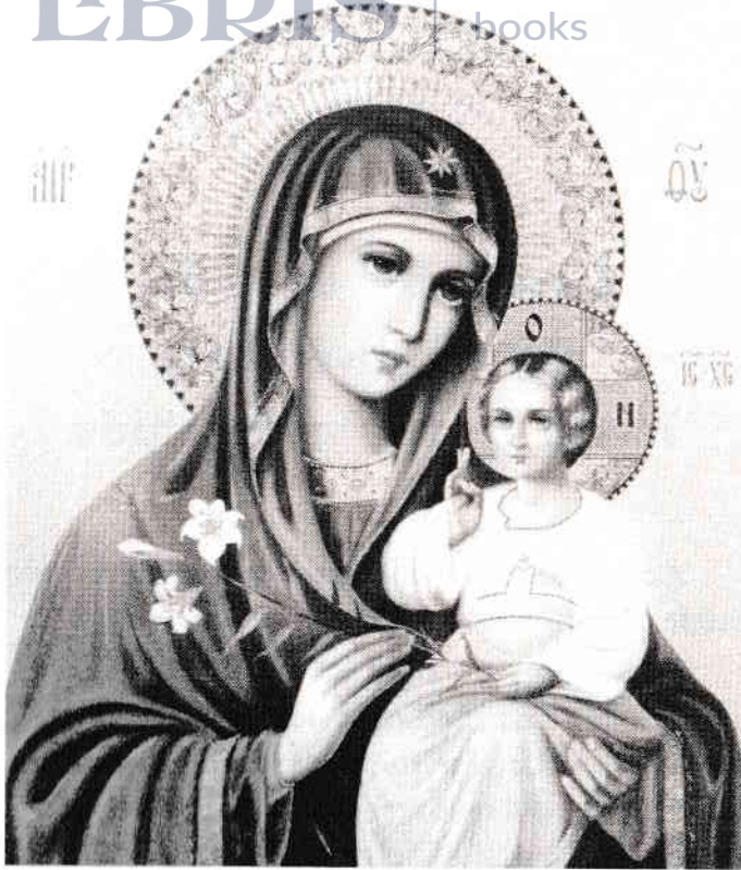
Icoana Maicii Domnului